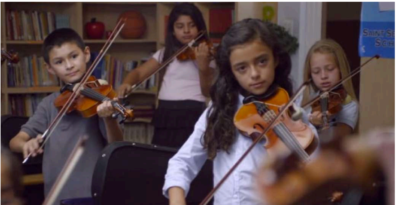
Niños de Education Through Music.

Después de establecer una alianza de colaboración con la institución norteamericana Education Through Music , Fundación Ibáñez Atkinson lanza el programa Música Educa . El objetivo es crear conciencia en el sistema educacional de Chile sobre la importancia de la asignatura de música y promover una correcta ejecución de ésta a través del perfeccionamiento constante de profesores y asesoría administrativa.