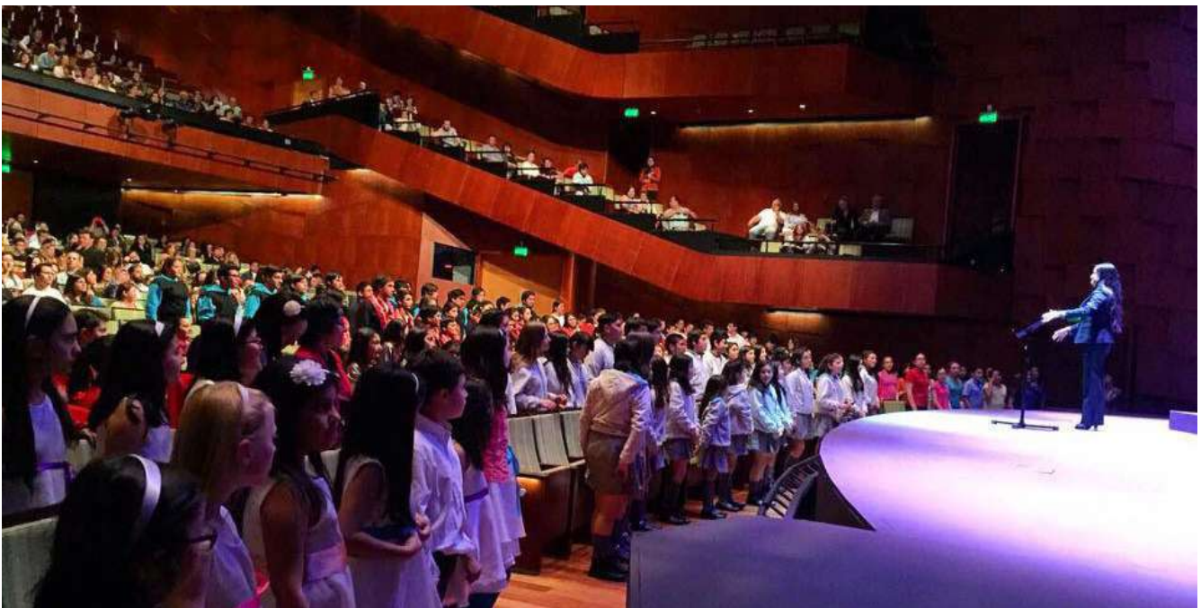
CORO DE ADULTOS DE PROGRAMA "PUEDES CANTAR", en Alianza con Teatro del Lago.

Este programa se ha visto beneficiado con la incorporación de actividades educativas como butacas educativas y EduVida, conforme a un plan anual de programación.